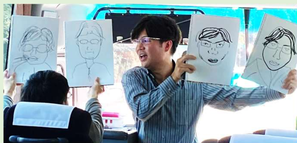
バス中のレクリエーションで自身の 似顔絵を4枚と新子 似てますかね？