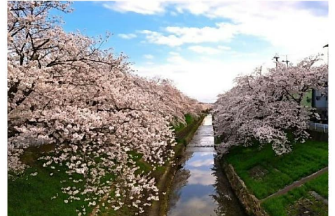
奈良センターオフィス近くの佐保川の桜