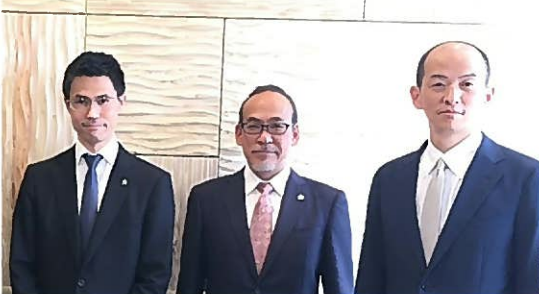
あおば 社員税理士 近影 奈良センターオフィスにて