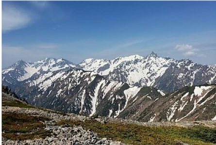
大天井岳頂上にて（標高 2,922m）